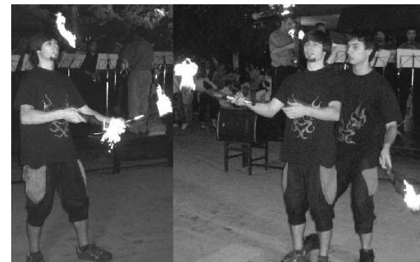
И театарскиот оган е зајален - групата на МКЦ - Скопје