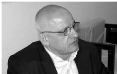
Слободан Деспотовски режисер