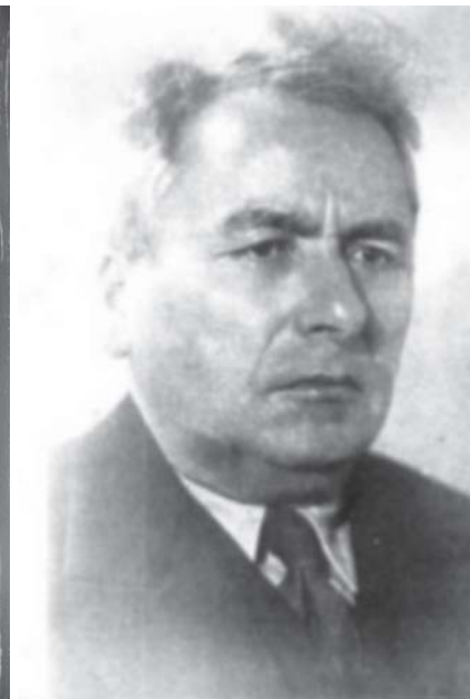
ВОЈДАН ЧЕРНОДРИНСКИ (1875-1951)