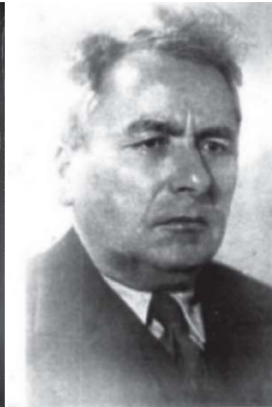
ВОЈДАН ЧЕРНОДРИНСКИ (1875-1951)