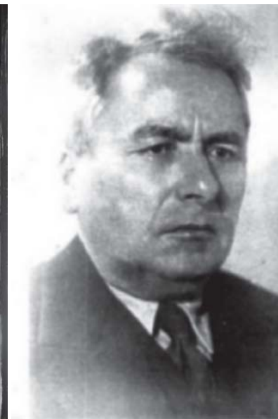
ВОЈДАН ЧЕРНОДРИНСКИ (1875-1951)