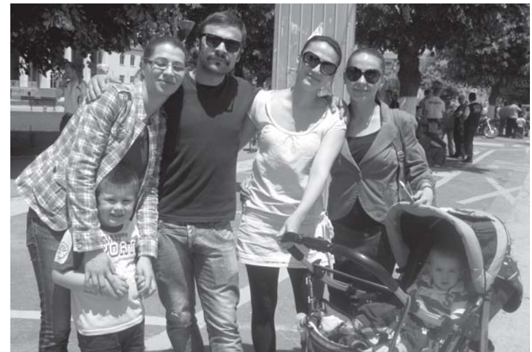
Сите во театар: Новите актерски "сили" на прилепскиот театар