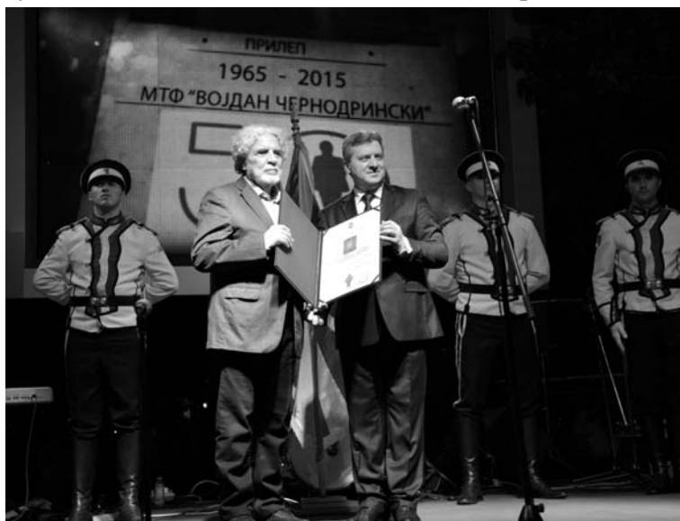
Повелбата на Република Македонија претседателот Ѓорге Иванов му ја врачува на Петар Темелковски

Актерите од повеќето македонски театри во чест на роденденот на Фестивалот ги изведоа перформансот "Земјата на Чернодрински" и концертот на актерските ѕвезди во режија на Дејан Пројковски. Богатиот огномет беше потврда на свечениот амбиент во кој почна Фестивалот.