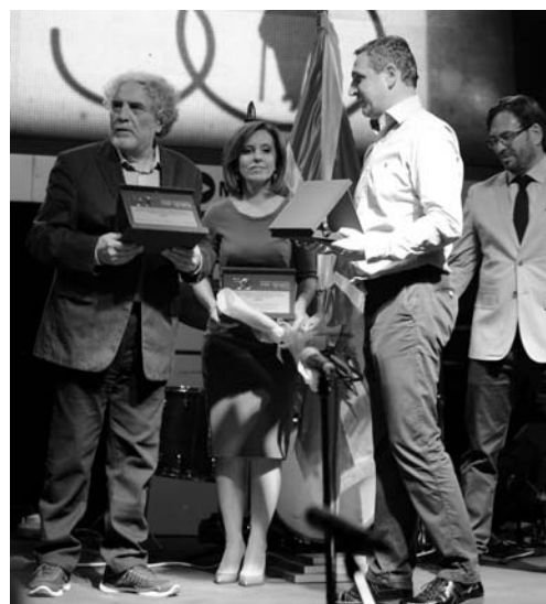
Признание од Фестивалот за ПИ "Витаминка" и "Прилепска пиварница"