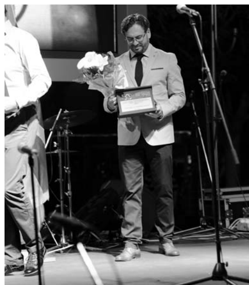
Признание од Фестивалот за општина Прилеп