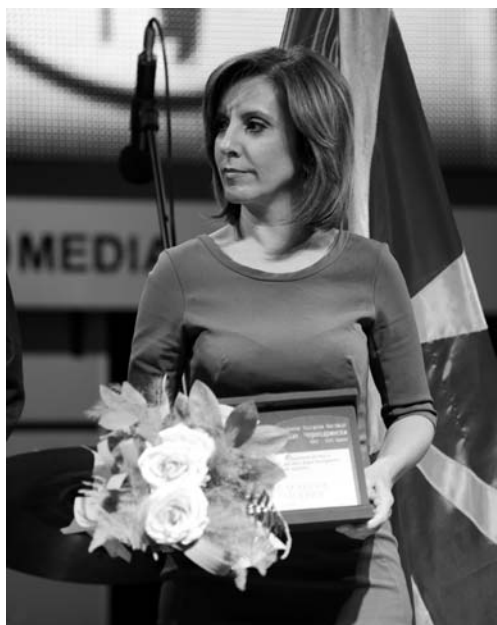
Признание од Фестивалот за Министерството за култура